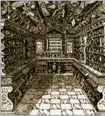
Cabinets de curiosité du XVIIème siècle