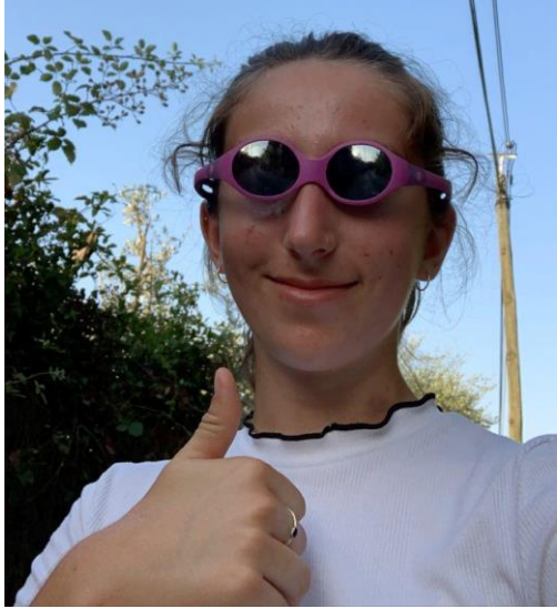
JUSTINE alias JuLstine HISTOIRE