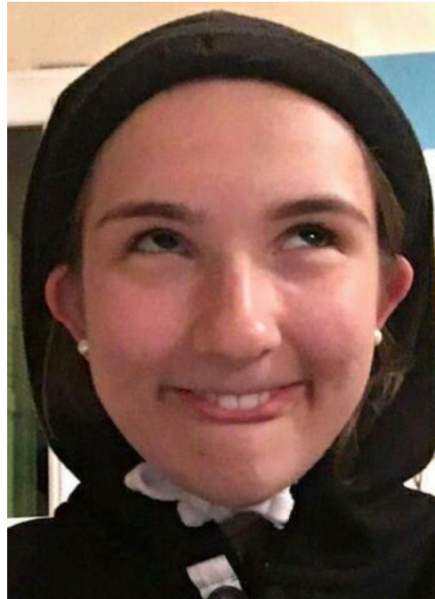
MELANIE alias Mélanocyte Ethique