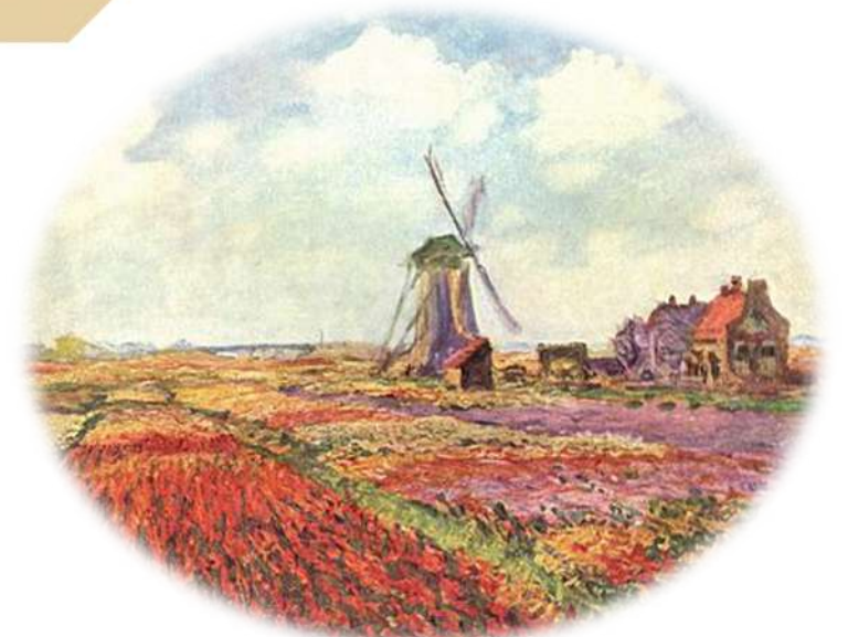
Petit paysage reflétant la beauté de la SP

1 re moitié du XXe siècle La phase de transition