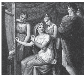
Pénélope tissant, Gravure d'après Henry Howard