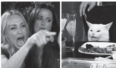
La Passoire Anonyme 40