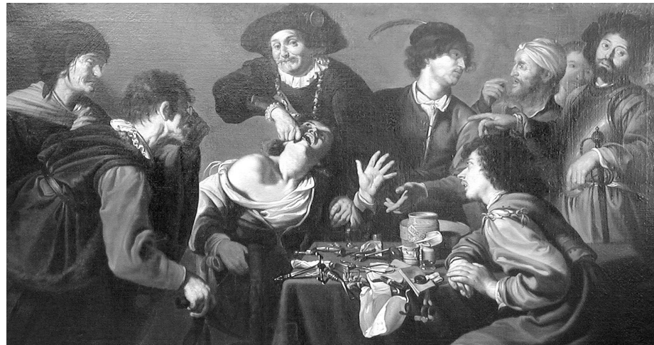
Théodore Rombouts - L'arracheur de dents

Quant au contenu des cours, il y a finale-