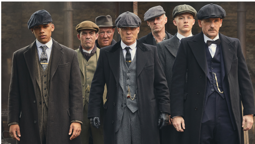
TOI ET TA CLIQUE DÉBARQUANT EN P2 COMME DES BOSS