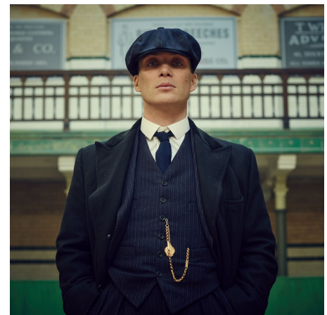
TOI PERFECTANT L'ÉTHIQUE (ET LE RESTE) AU CONCOURS