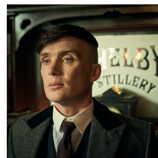
TOI CONTENT (ça se voit mdrr) APRÈS AVOIR RÉUSSI LE TUT COMME UN DIEU