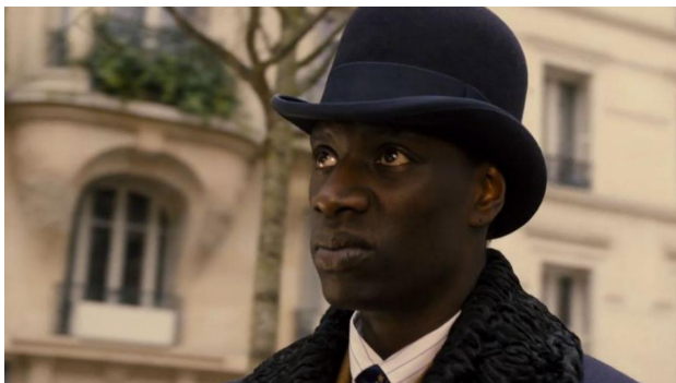
TOI FACE AU PALAIS DES EXPOSITIONS LE 11 ET 12 MAI