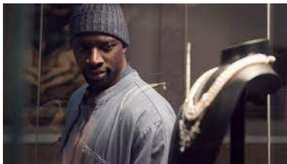
TOI REREGARDANT LA P2 (JURÉ ELLE ARRIVE)