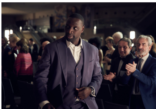
TOI À LA RENTRÉE P2 L'ANNÉE PRO