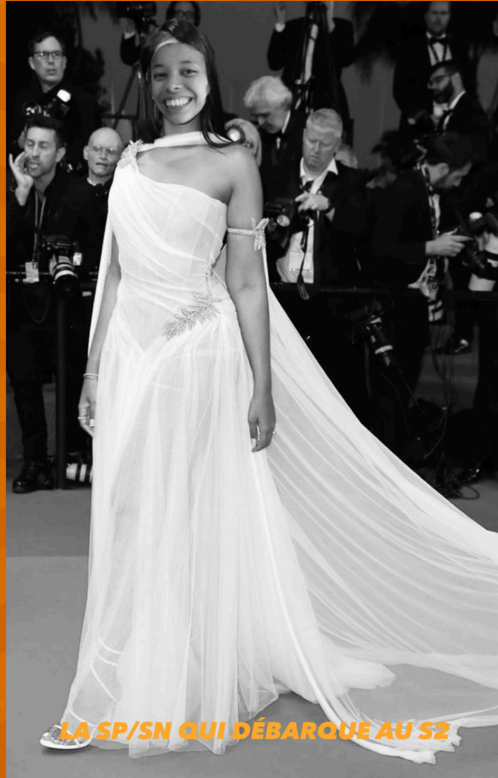
LA SP/SN QUI DÉBARQUE AU S2