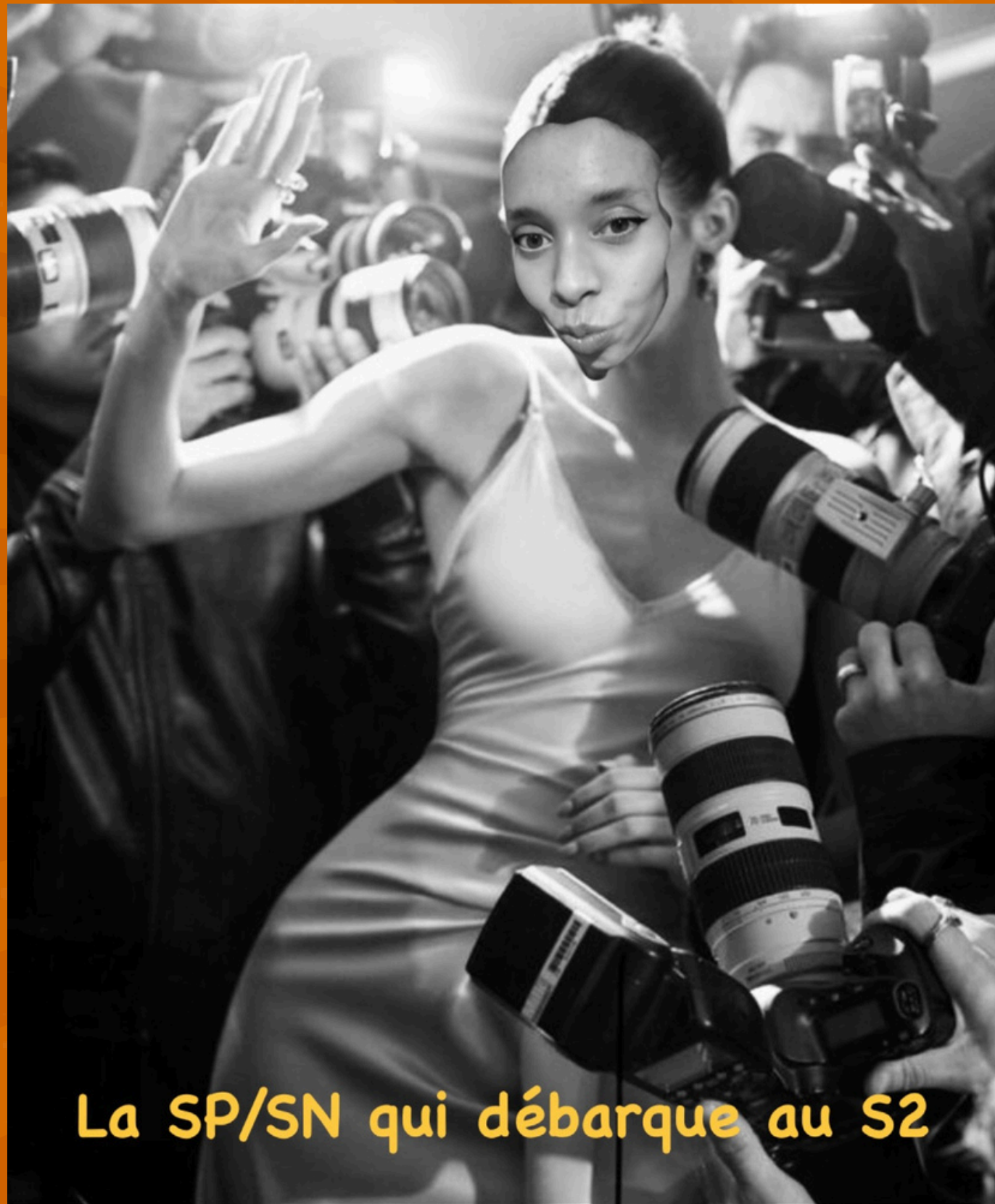
La SP/SN qui débarque au S2