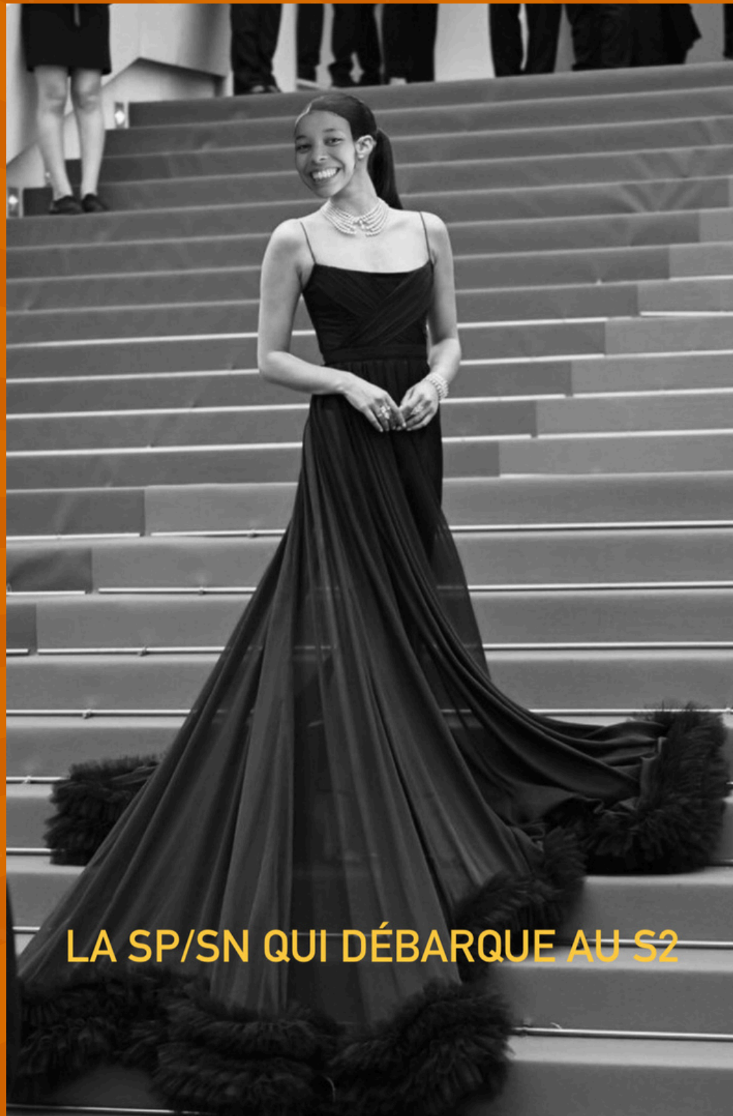
LA SP/SN QUI DÉBARQUE AU S2